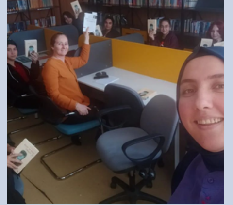
Okuma Kulübü Faaliyetleri