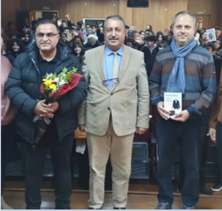
Yazar - Okur Buluşmaları