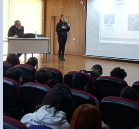
Kitap Sunum Günleri