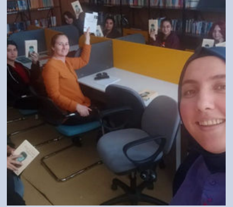
Okuma Kulübü Faaliyetleri